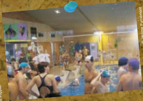
23 novembre - La piscine en fête, organisé de mains de maître par l'équipe jamboise