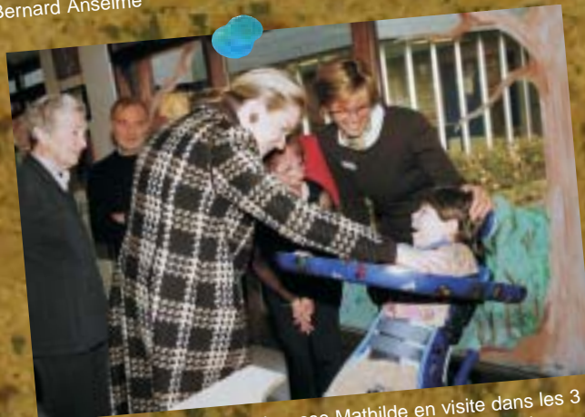
12 novembre - SAR la Princesse Mathilde en visite dans les 3 institutions pour polyhandicapés, Les Perce-Neige, La Douceur Mosane et les Côteaux Mosans. Belle reconnaissance pour les équipes qui œuvrent au quotidien