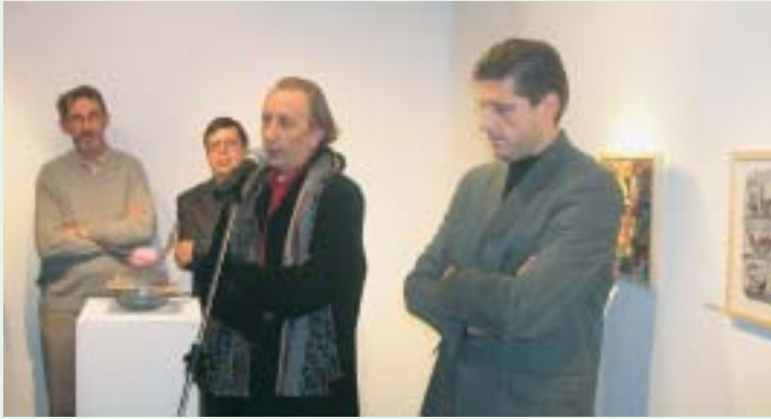
Ci-dessus les différents acteurs de la Galerie lors du vernissage du trentième anniversaire.