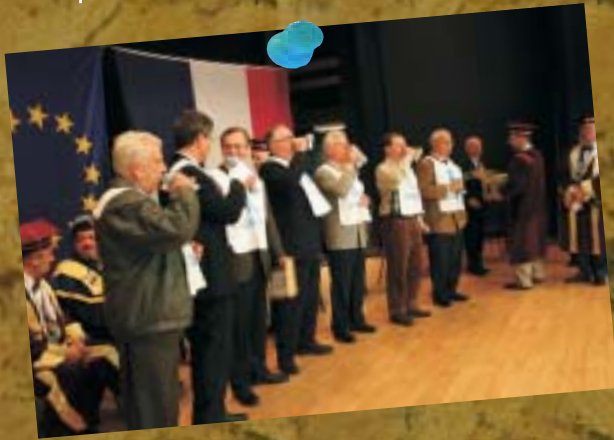
12 octobre - 30 ème chapitre de la Confrérie de St Vincent