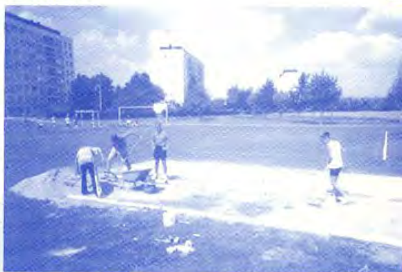
Une partie de l'équipe au travail l'été dernier