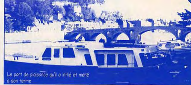
Le port de plaisance qu'il a initié et mené à son terme

Un homme de caractère : vous pouviez avoir