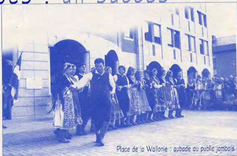
Place de la Wallonie : aubade au public jambois

Fidèle à sa volonté de ne pas rester endormi sur ses lauriers, le Festival de Folklore 1998 a prouvé à son très fidèle public, que d'ailleurs il remercie d'avoir répondu si nombreux à son invitation, qu'il tenait compte de son espoir de revenir à la Patinoire «La Mosane».