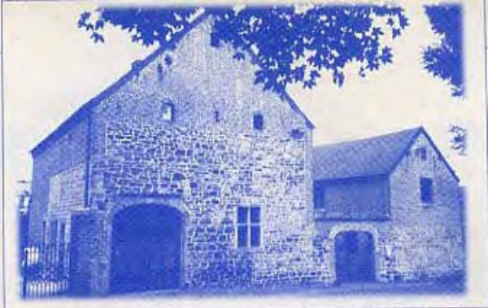
L'atelier et la maison de l'artiste

W. Vd.R. : Grâce à l'aide précieuse de mes fils, j'ai pu effectuer la plus grosse partie des travaux, et j'avoue être assez fier du résultat.