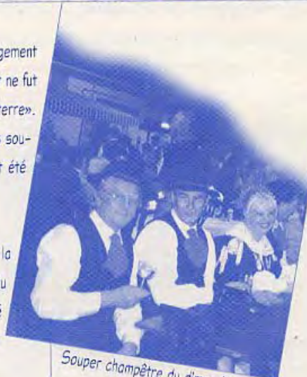
Souper champêtre du dimanche soir