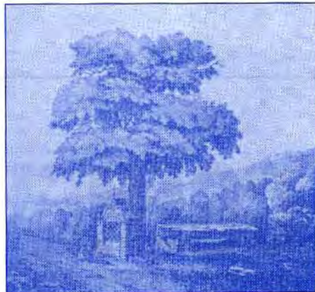
Dessin du Dolmen de Jambes réalisé par J. Grandgagnage.

La présence d'une pareille table de pierre a pu perturber les esprits. Les géologues attestent que les pierres pourraient provenir de gisements situés en amont de Jambes (région de Dave, Wépion, Naninne) ou en aval (région nord d'Erpent). De nouvelles études géologiques pourraient affiner les thèses. Mais comment ces pierres ont-elles été transportées ?