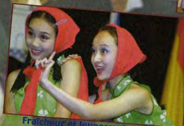
Fraîcheur et jeunesse des Chinoises