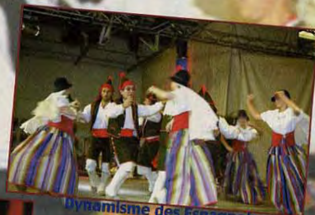
Dynamisme des Espagnols