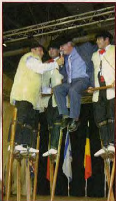
Présentation originale du groupe des Landes par Francis Delvaux