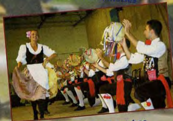
Chaleur sicilienne à Jambes