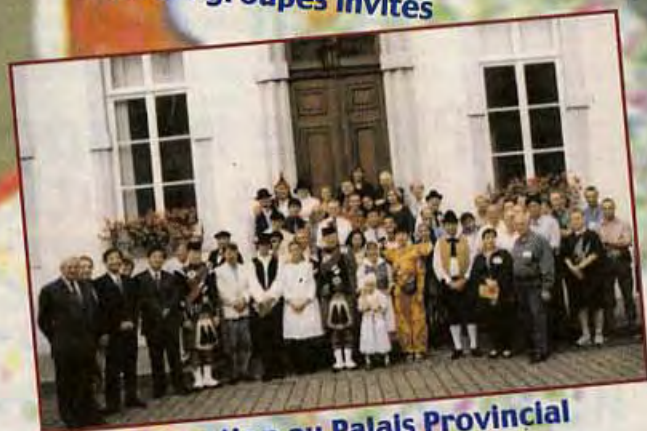
Réception au Palais Provincial des différentes délégations