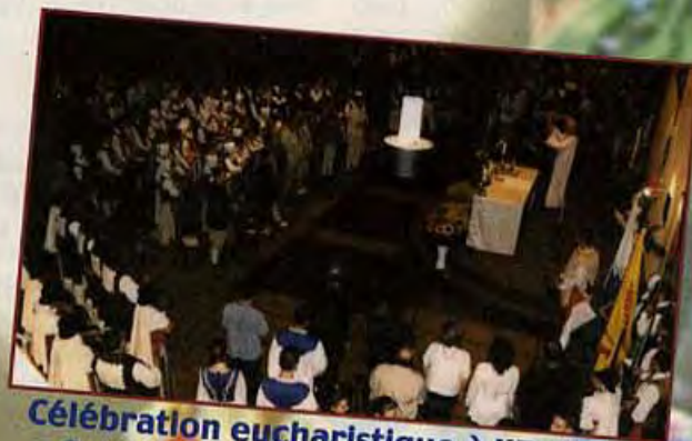
Célébration eucharistique à l'Eglise Saint Symphorien en présence de tous les groupes invités