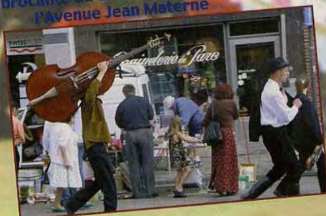
Ballade des Hongrois dans la brocante du dimanche matin dans l'Avenue Jean Materne