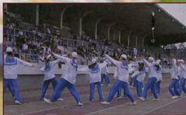
Animation du groupe Israélien au stade à l'occasion d'Atletissima 2000