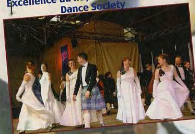
Excellence du Royal Scottish Country Dance Society