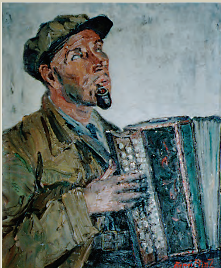
RENÉE PRINZ L'aveugle du Pont de Jambes Huile sur toile. 59,5 x 49,5 cm. Coll. Ville de Namur.