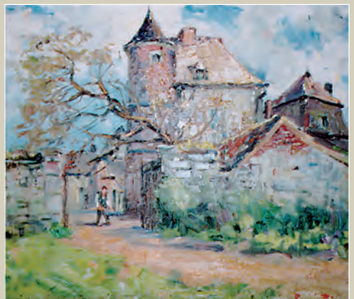
RENÉE PRINZ La tour d'Enhaive Huile sur toile. 71,5 x 63,5 cm. Coll. Ville de Namur.