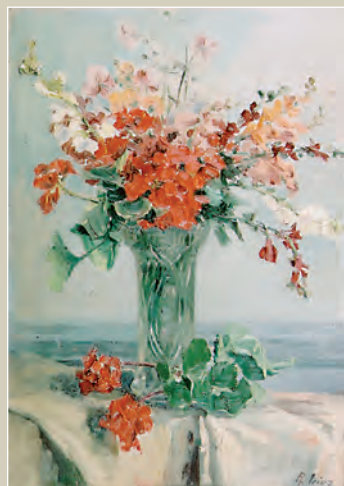
RENÉE PRINZ Fleurs rouges, roses et jaunes au vase vert Huile sur toile. 67 x 48,5 cm. Coll. Ville de Namur.

vision synthétique toute personnelle. Le paysage est son sujet de prédilection, et elle le traite débordant de couleur et baigné de lumière. Sa peinture est faite de petites touches rapides et spontanées. Sa production comporte aussi des natures mortes et des portraits. Elle affectionne particulièrement la technique de la peinture à l'huile, de l'aquarelle mais aussi quelquefois du monotype. Ses formats sont généralement modestes car elle travaille « sur le motif ».