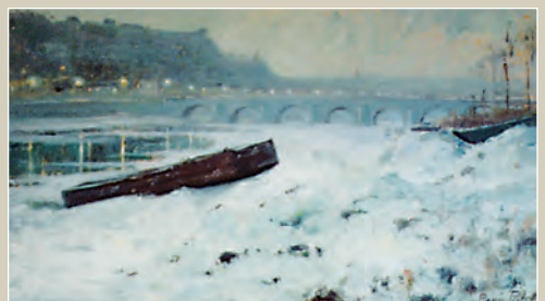
RENÉE PRINZ La Meuse à Namur Huile sur panneau. 94,5 x 58 cm. Coll. Ville de Namur.