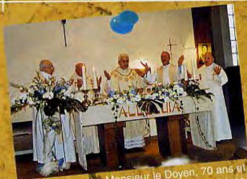
Bon anniversaire Monsieur le Doyen, 70 ans et toujours aussi disponible pour ses paroissiens