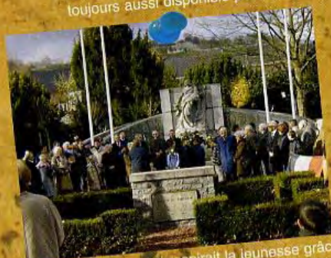
Un 11 novembre qui respirait la jeunesse grâce aux écoles jamboises qui avaient remarquablement préparé leur participation active.