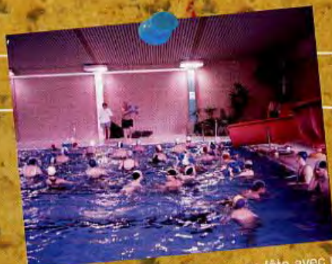
Edition très attendue de piscine en fête avec un dynamisme particulier des membres du personnel de notre infrastructure jamboise.