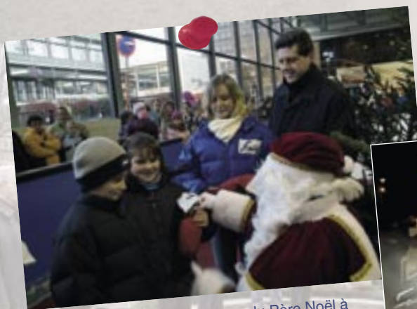
18 décembre : Présence du Père Noël à la Patinoire "La Mosane"