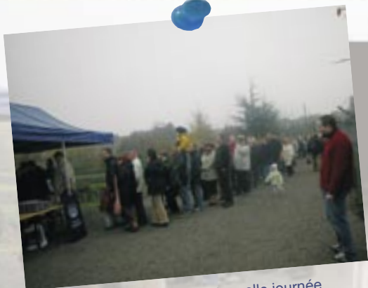
Le 19 novembre : Traditionnelle journée de l'arbre à Jambes