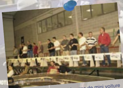
5 et 6 novembre : Les 24 heures de mini voiture