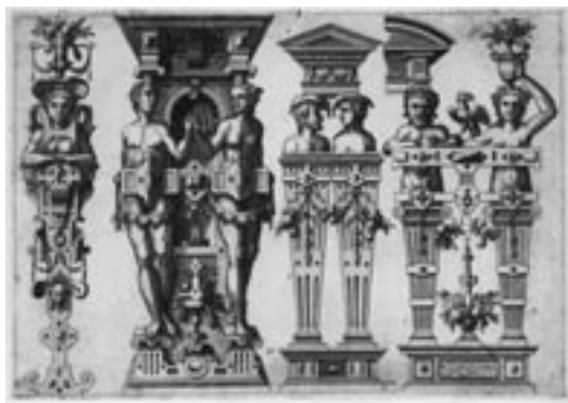
HANS VREDEMAN DE VRIES (1526-1606) Caryatides Gravure de Gérard de Jode (Anvers), 1565, H. x L. : 23,3 x 30 cm. Hambourg, Museum für Kunst und Gewerbe (Döry Nr. 581).

Cette sculpture est à rapprocher des modèles de Hans Vredeman de Vries (Leeuwarden / Frise, 1526 – Anvers, 1606) 4 . Cet artiste fut peintre, architecte, dessinateur d'architecture et d'ornements d'architecture, graveur et théoricien de la perspective. Les recueils de ce théoricien montrent des caryatides de ce type aux motifs décoratifs apparentés (tête de lion, coquilles, formes géométriques). Des motifs géométriques très semblables sont visibles sur l'intrados de