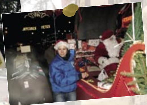
18 décembre : Le Père Noël accompagné de ses hôtesse distribue bonbons et ballons