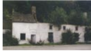
Le Moto Club Jambois

Situé chaussée de Liège (devant les terrains de Hockey), ce bâtiment a été démolé pour faire place à un grand complexe de bureaux en cours de construction.