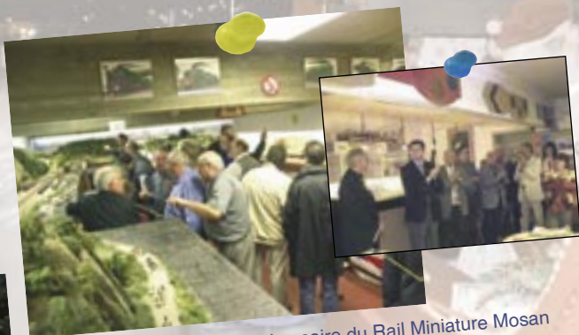
22 et 23 octobre : 40 ème anniversaire du Rail Miniature Mosan