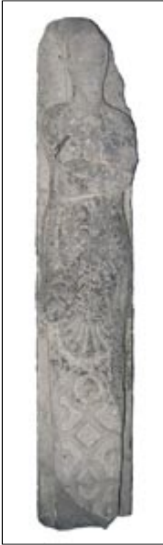
Jambage de cheminée avec caryatide Dernière décennie du XVI e siècle. Calcaire. H. x l. x P. : 126 x 23 x 29 cm. Don à la Fondation Roi Baudouin.

gine proche puisqu'elle proviendrait d'un bâtiment disparu érigé autrefois à Anhaive. Il est vrai que ce site a été dévasté et incendié à plusieurs reprises par des troupes armées. Plus récemment, le percement de la N4 dans les années 50 a engendré aussi la disparition de plusieurs constructions anciennes. Le jambage de cheminée proviendrait-il de cet endroit ? C'est une hypothèse plausible.