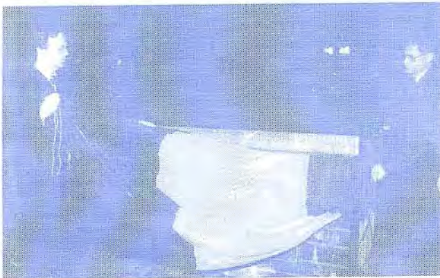
Les Echevins PONCELET et CHENOY dévoilant la stèle

La seconde partie de la cérémonie fut marquée par l'intervention du fils du Commandant Abel REMY et par le dévoilement des couleurs nationales laissant ainsi apparaître la stèle commémorative de l'Aire du Souvenir Abel REMY.